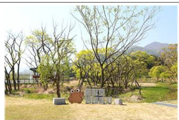
동정호 생태습지 탐방