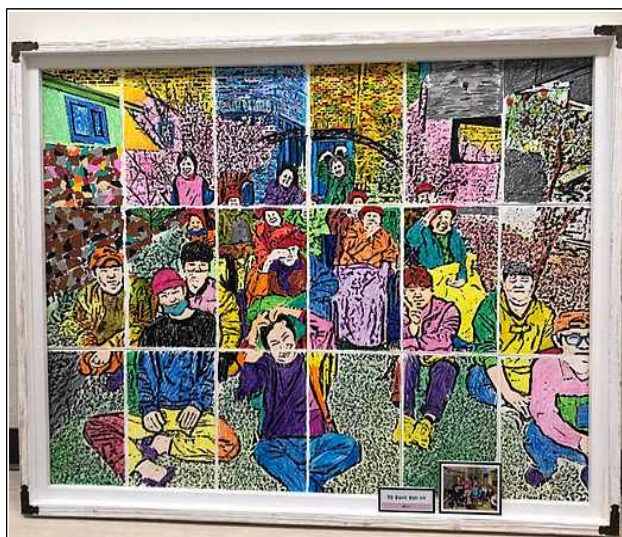
단체 <2019년 치매어르신 프로그램 작품 대상>