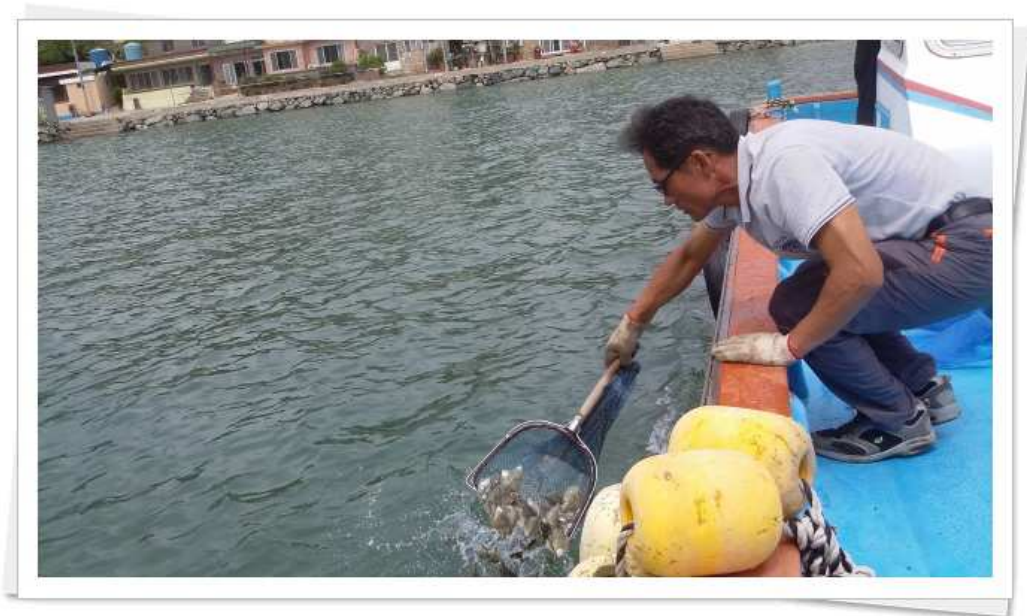
『금남 해역 지역특산어종 돌가자미 방류』