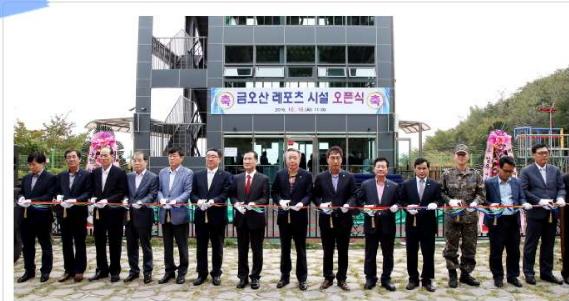
『2016.10.18 금오산 레포츠 시설 오픈식』