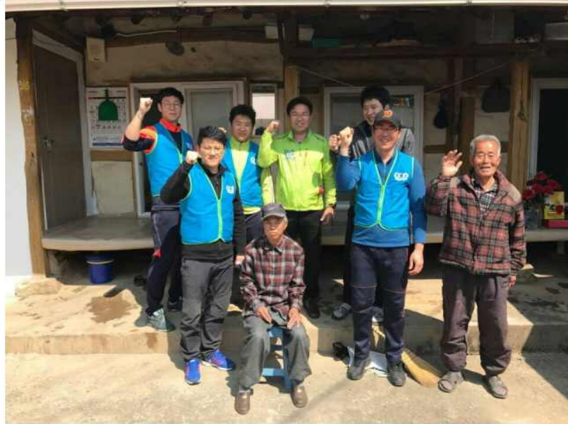
청년회 예쁜방 꾸미기 봉사활동(2017.3.19)