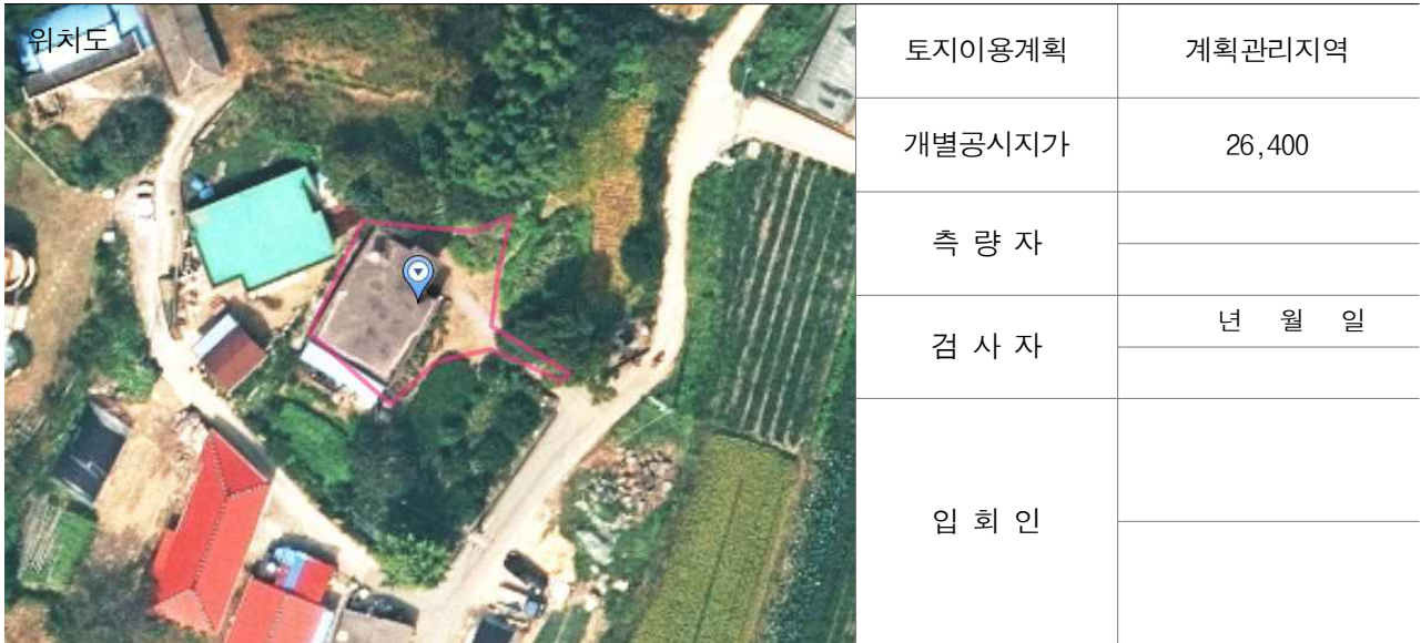
경계점 위치 설명도