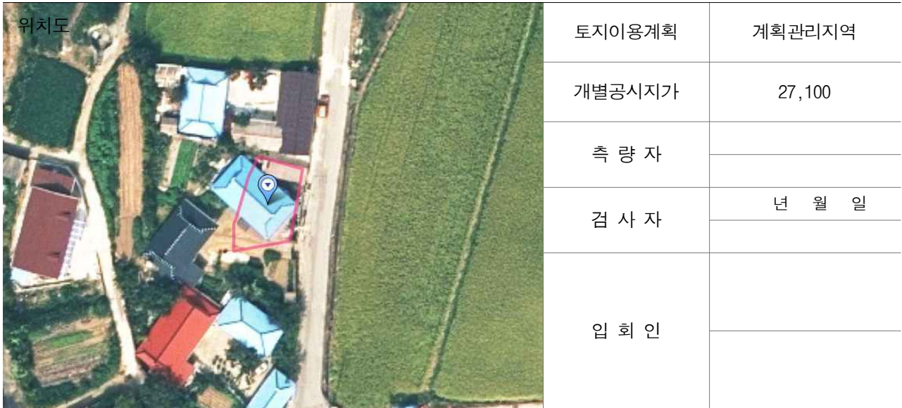
경계점 위치 설명도