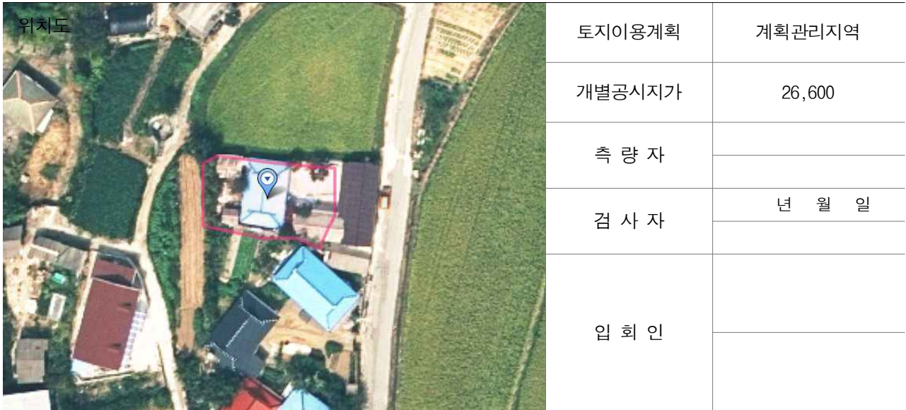
경계점 위치 설명도