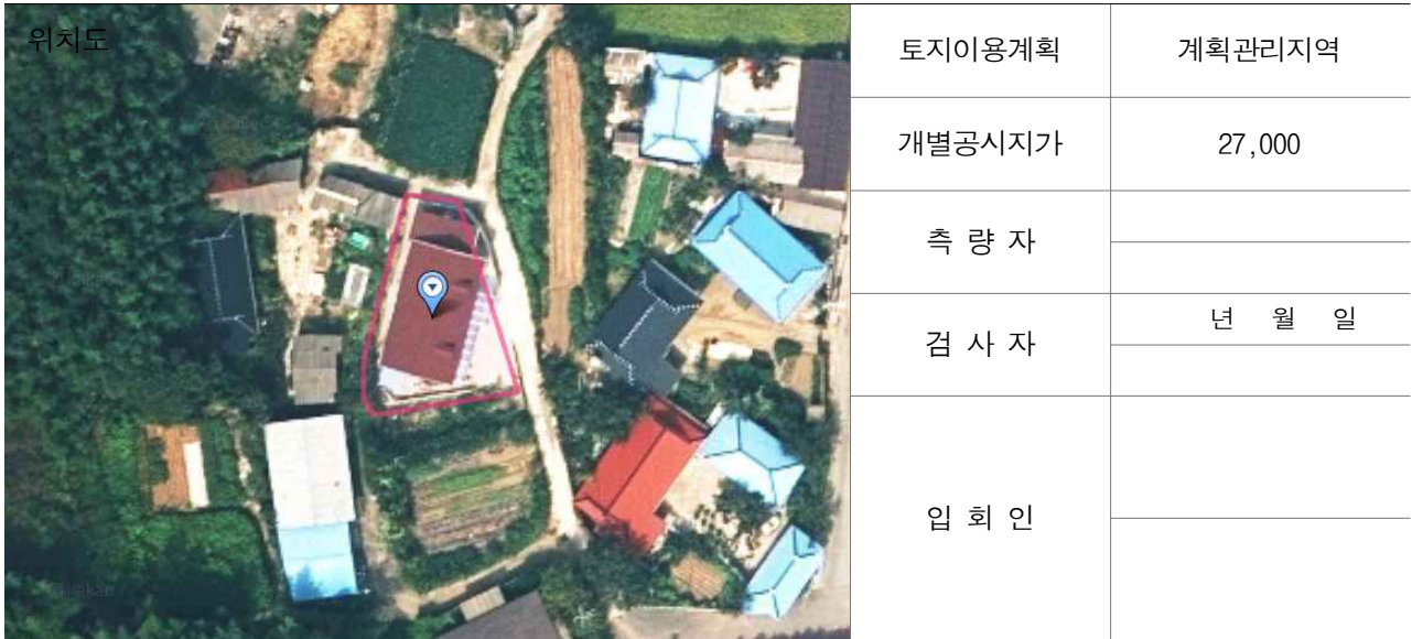
경계점 위치 설명도