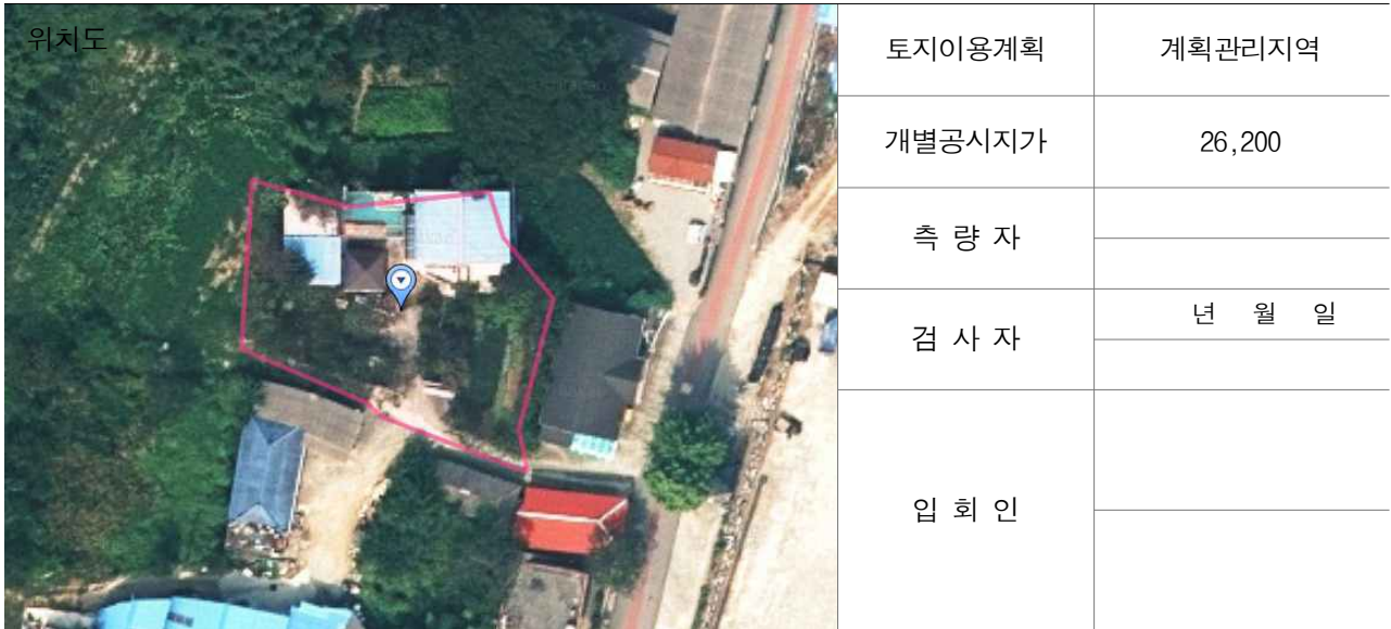
경계점 위치 설명도