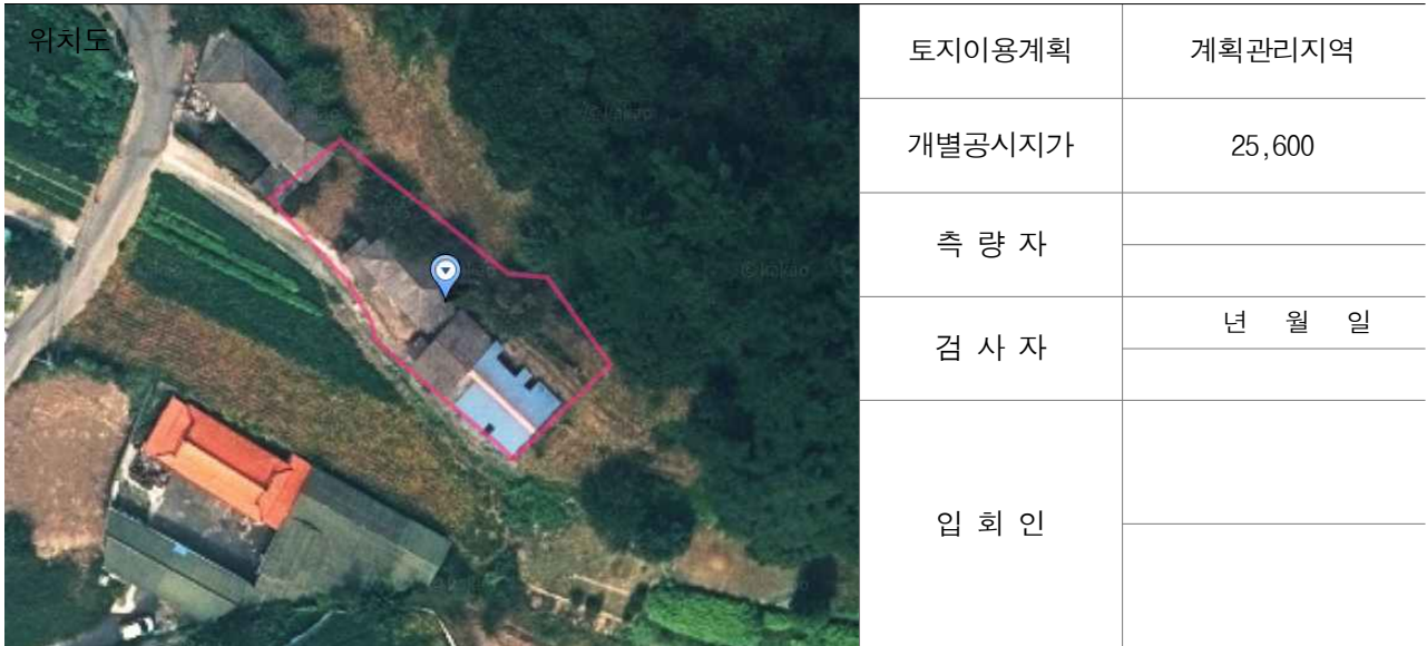
경계점 위치 설명도