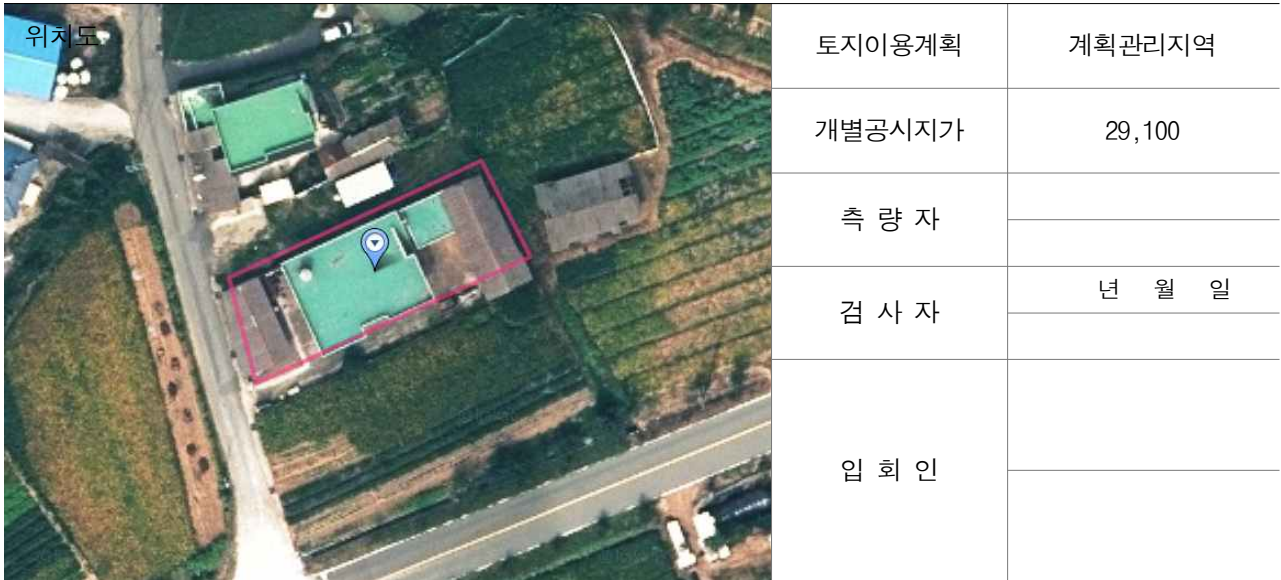
경계점 위치 설명도