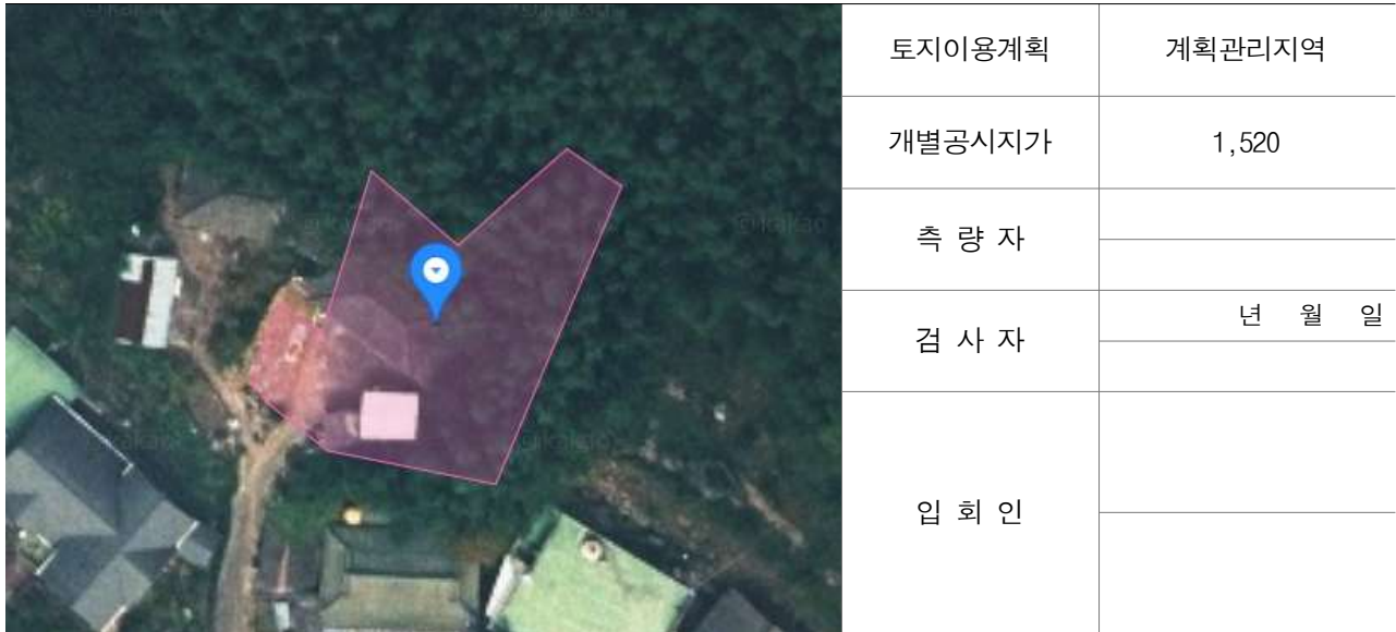
경계점 위치 설명도