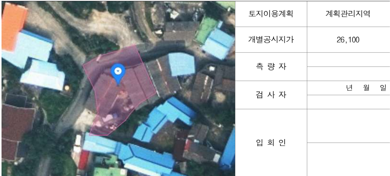
경계점 위치 설명도