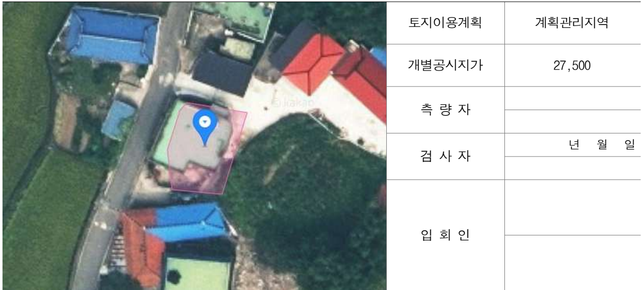
경계점 위치 설명도