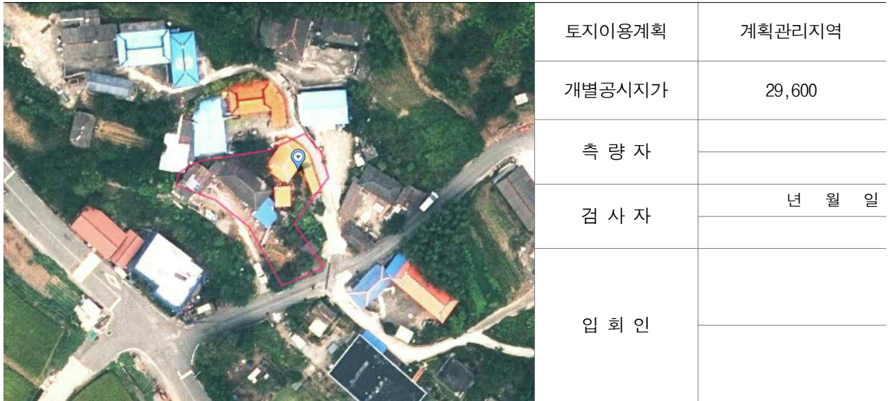
경계점 위치 설명도