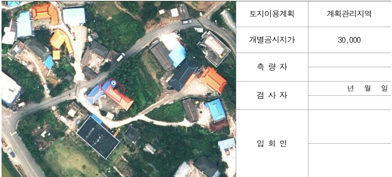
경계점 위치 설명도