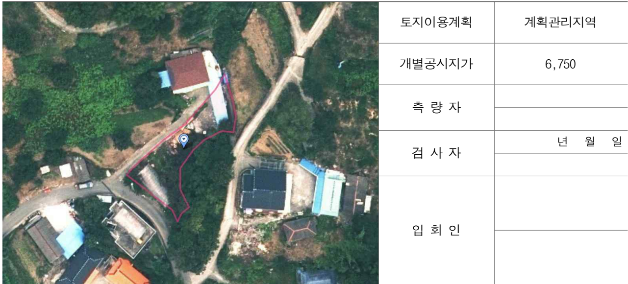
경계점 위치 설명도