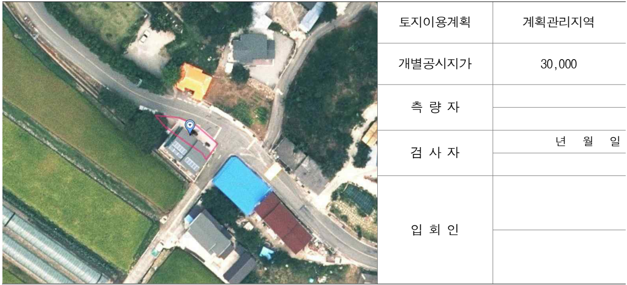
경계점 위치 설명도