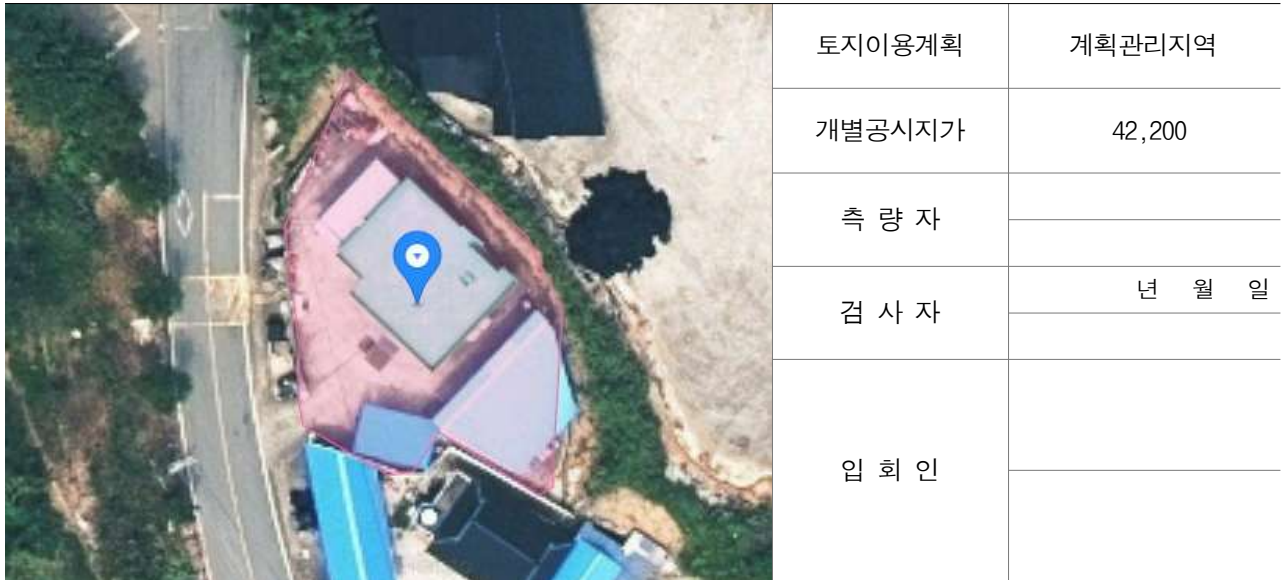
경계점 위치 설명도