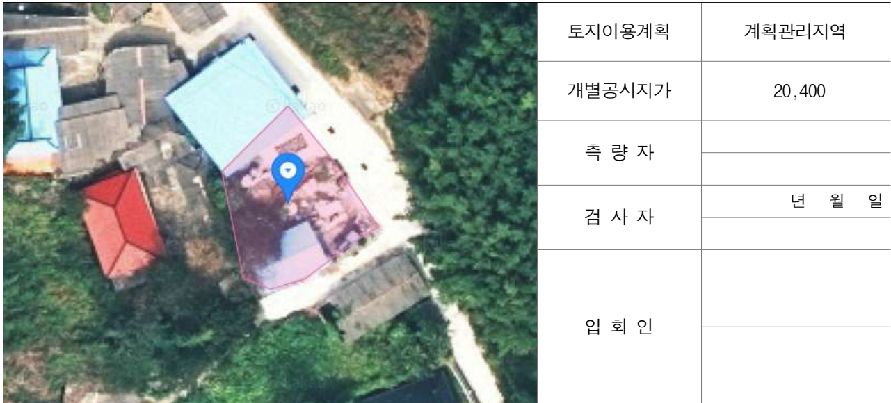
경계점 위치 설명도