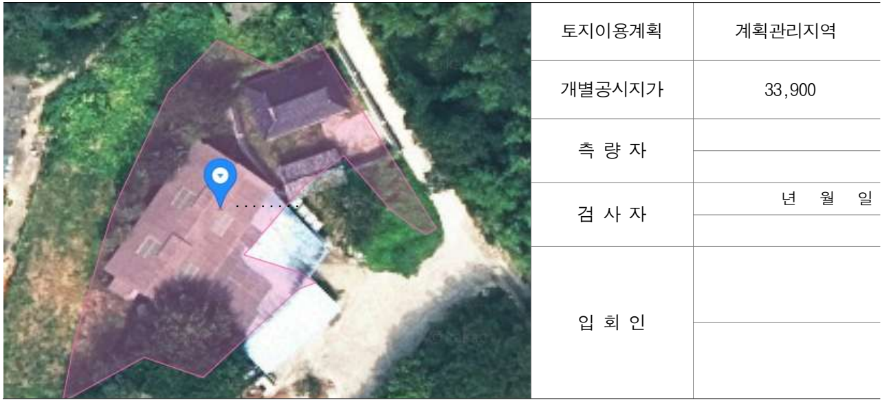
경계점 위치 설명도