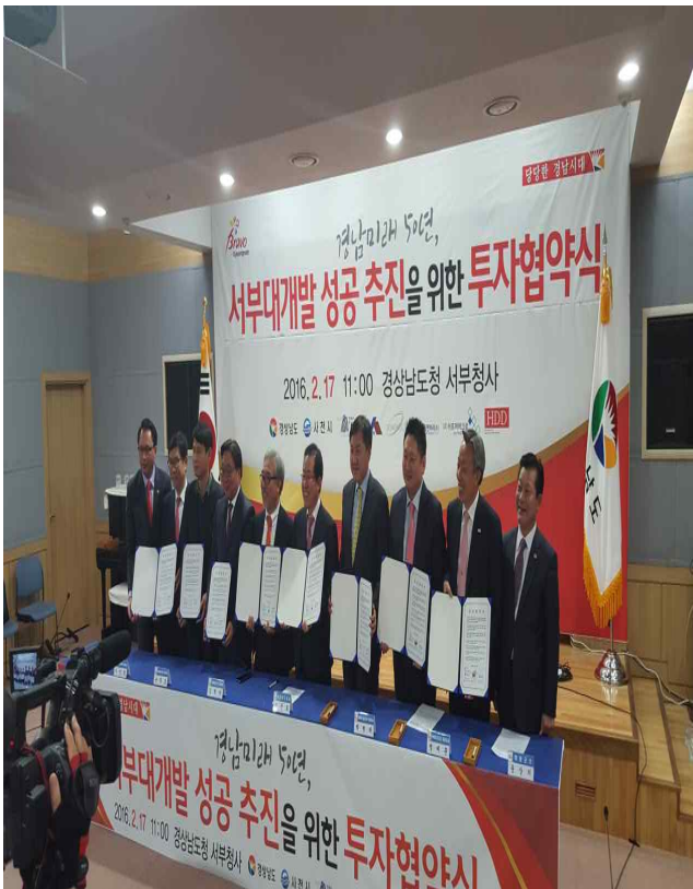
경남도, 하동군, (주)HDD MOU체결