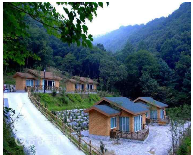
명상치유센터 (계획 - 민간유치)