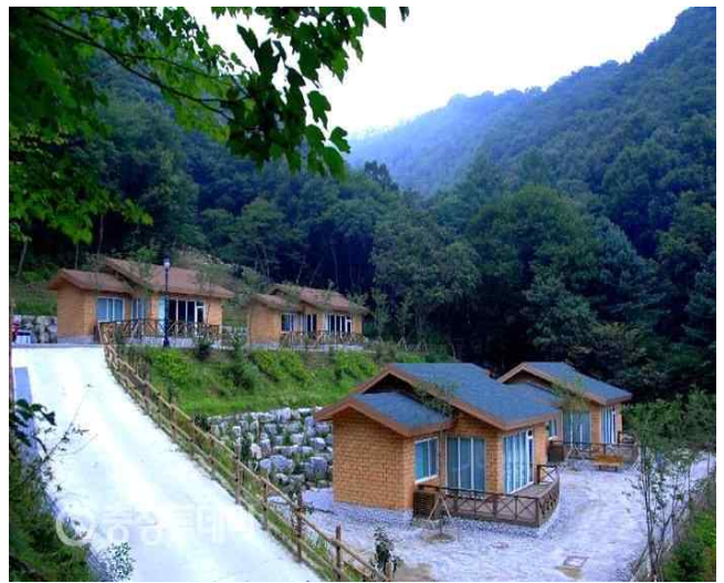
명상치유센터 (계획 - 민간유치)