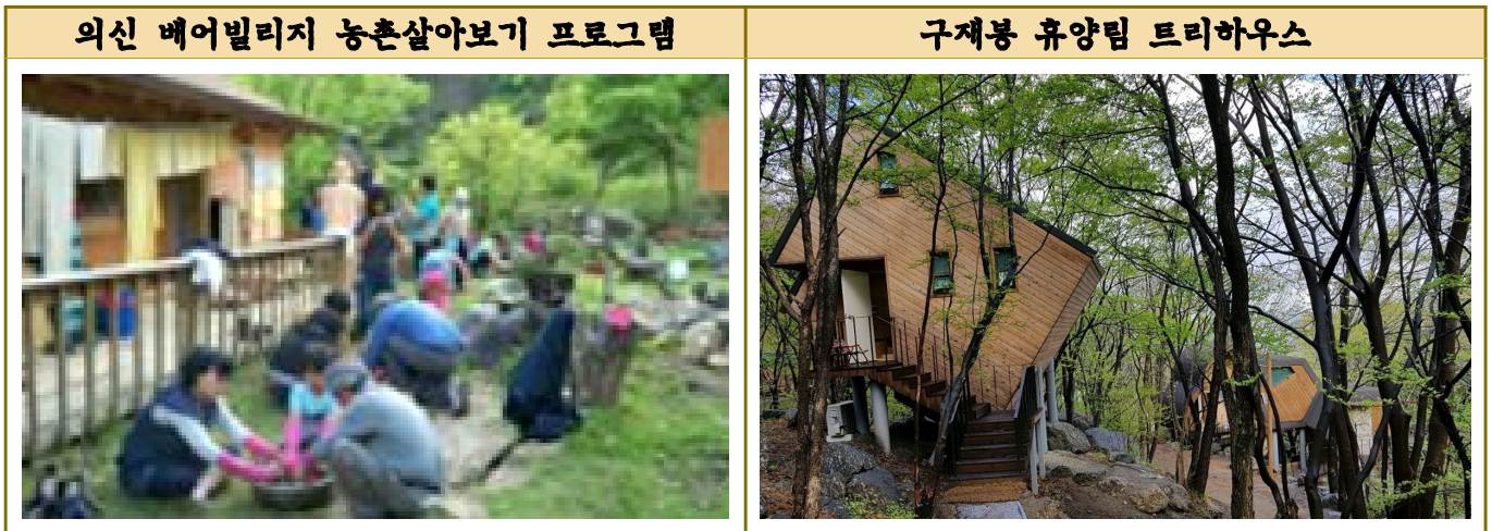
사진 및 자료