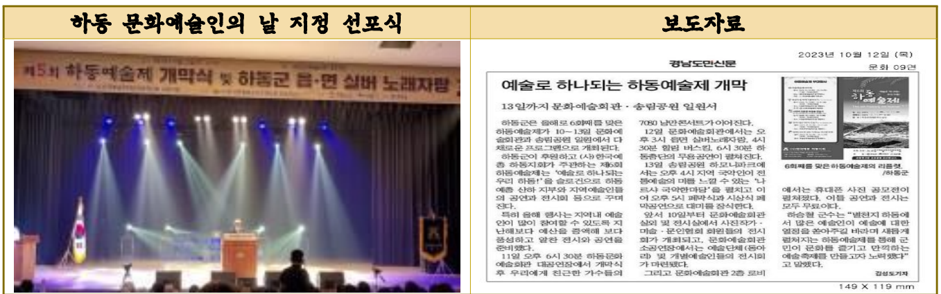
사진 및 자료