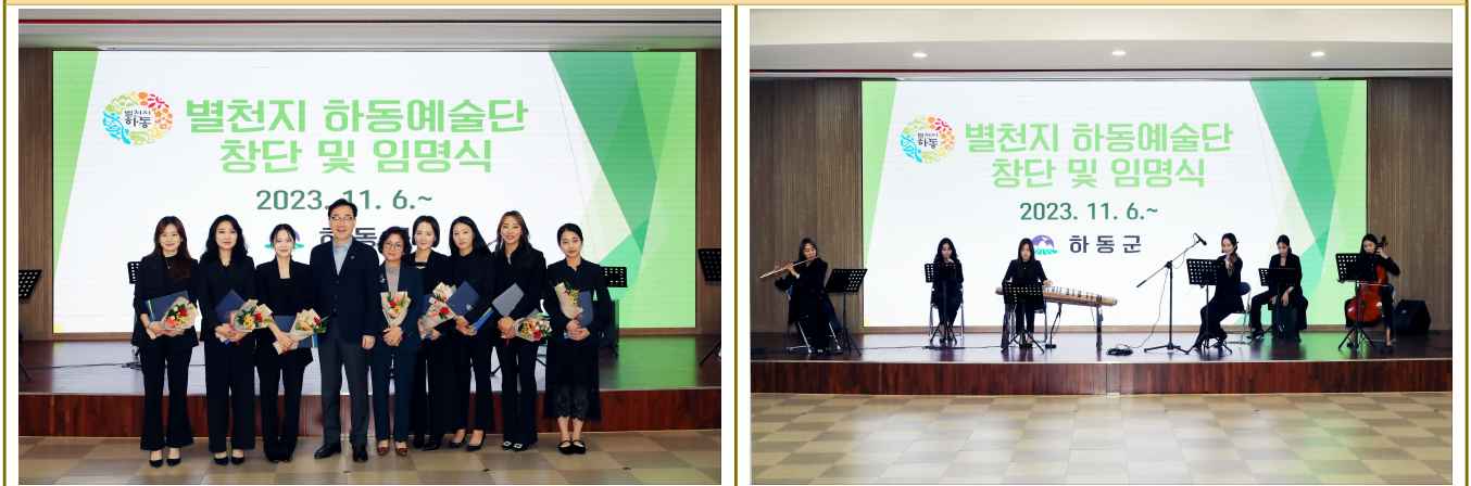
별천지 하동예술단 창단 및 임명식