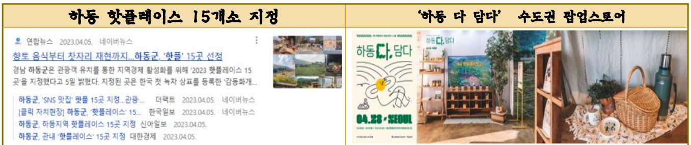
사진 및 자료