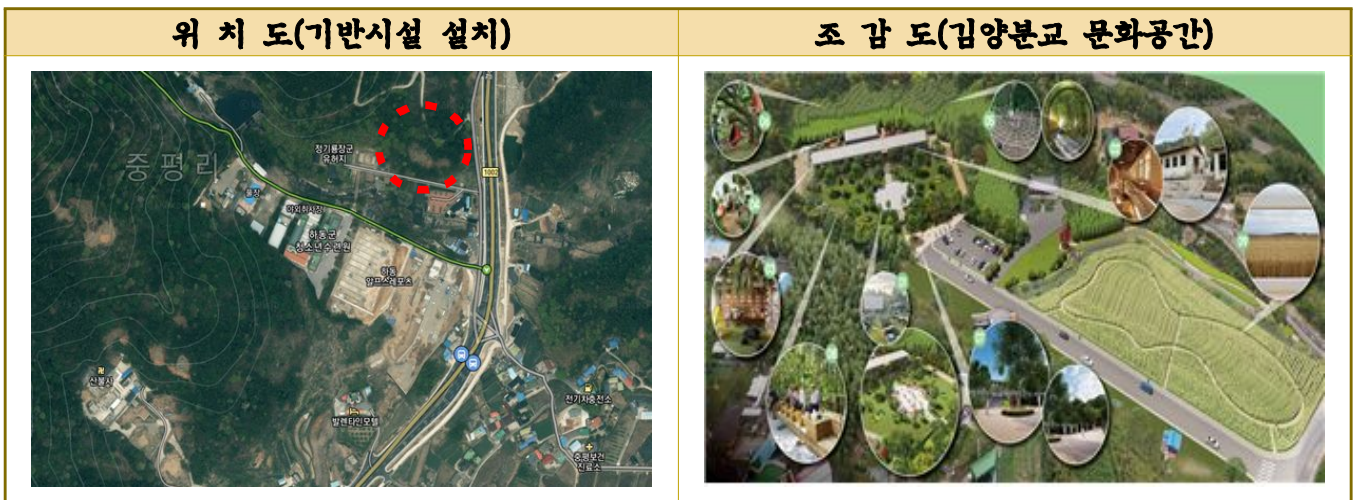
사진 및 자료