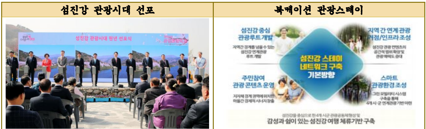
사진 및 자료