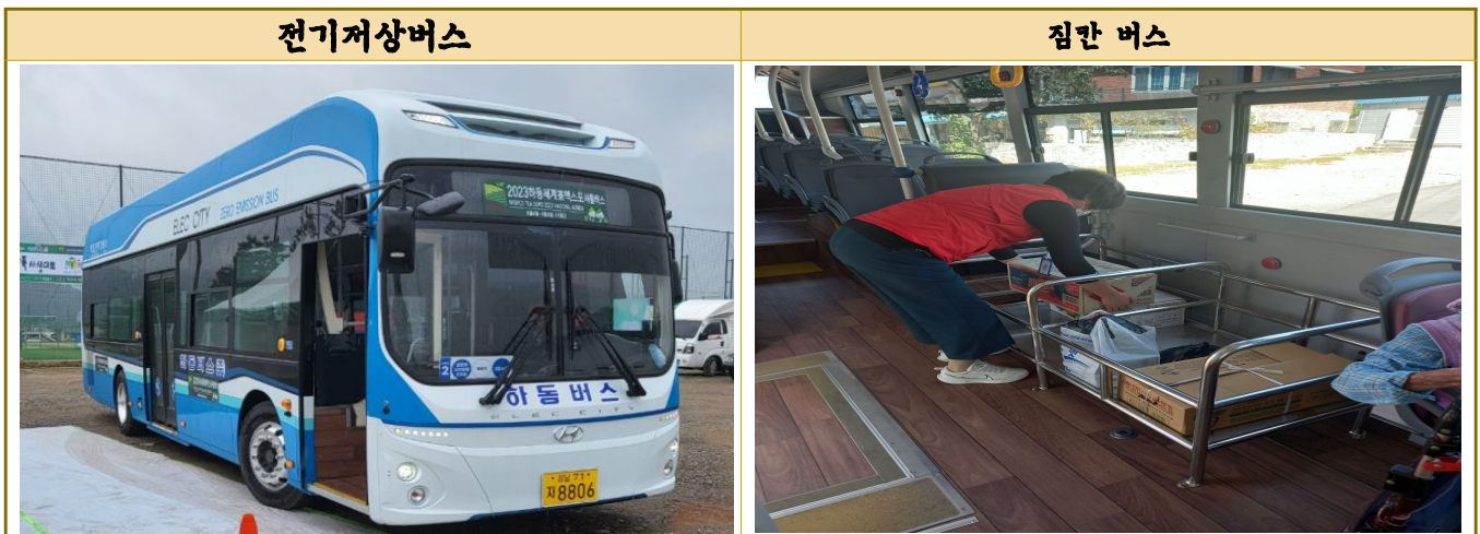
사진 및 자료