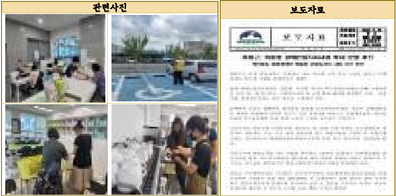
사진 및 자료