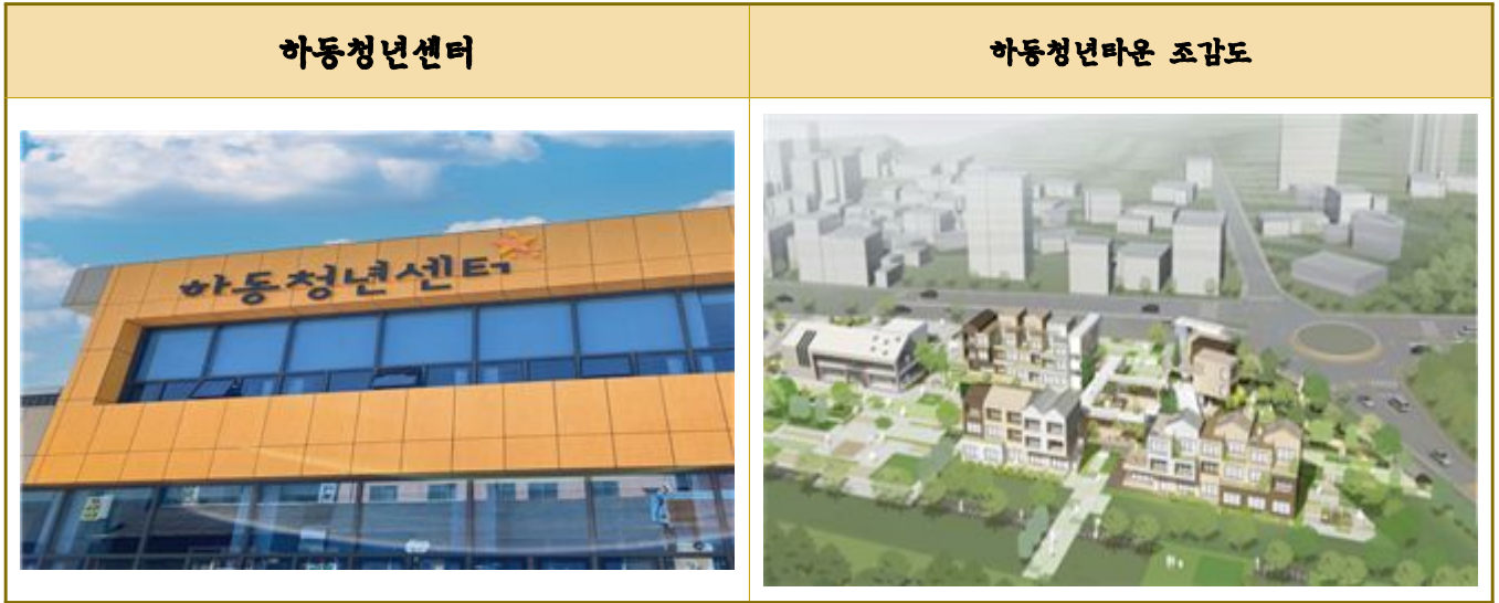
사진 및 자료