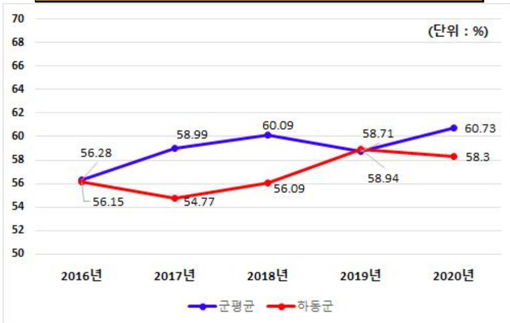
유사 지방자치단체와 재정자주도(당초예산) 비교

우리군은 국도비 보조금 비중이 36.9%로(자주재원의 비중 63.1%) 다소 높은 재정여건을 보이고 있으며, 재정자주도는 지난해 보다 소폭 감소한 58.3%를 기록하고 있어 유사단체 평균보다 2.43% 낮은 상황임. 이는 현안사업의 국도비 보조금 확보액이 증가함에 따라 재정자주도가 감소한 것으로 보임.