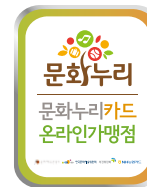
가맹점 스티커 (오프라인)