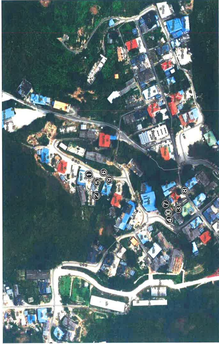
[별첨 2] 측정위치도