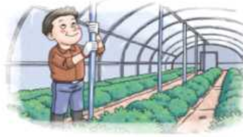
▲ 노후화된 시설 등은 보강자주 설치