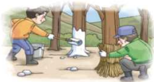
▲ 과수 주간부 벗짐피복 또는 수성페인트 칠하기