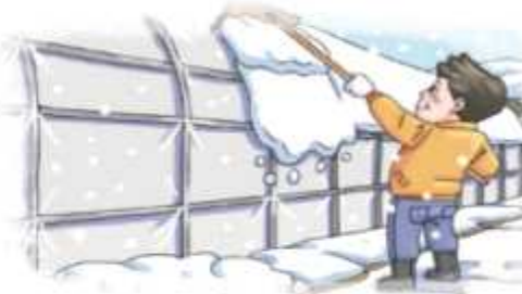
▲ 하우스 위 눈 쓸어 내기