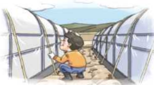
▲ 시설하우스 고정끈 설치 및 보강