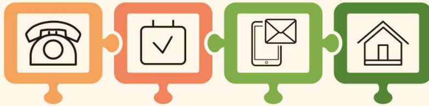
사전등록 및 방문상담

발달장애인 보호자의 입원, 경조사 등 긴급한 상황 발생 시 발달장애인에게 일시적(7일 이내)으로 24시간 돌봄을 지원하는 서비스