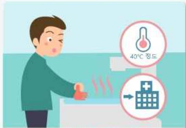
동상에 걸리면, 따뜻한 물에 30분가량 담그고 온도를 유지하며 즉시 병원으로 갑니다.