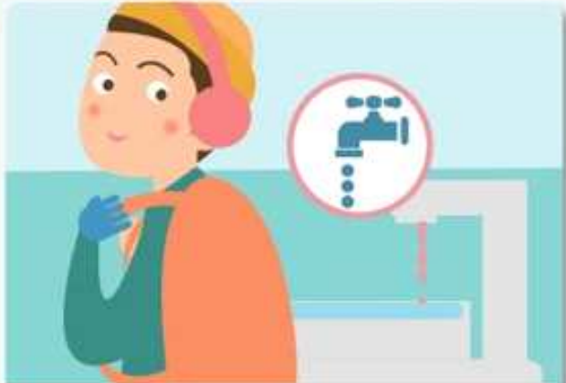
장기간 외출 시 온수를 약하게 틀어 동파를 방지합니다.