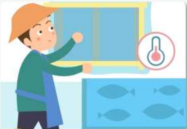
양식장에 율동장을 설치하고, 방풍망을 준비합니다.