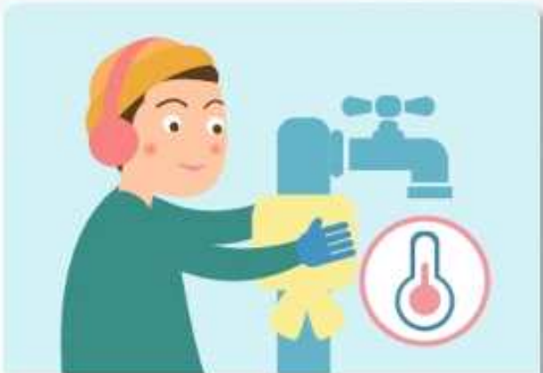
수도계량기, 보일러 배관 등은 현 옷 등으로 보온합니다.