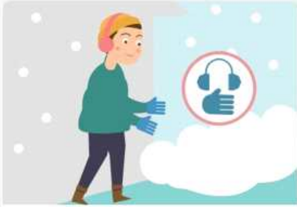
외출 시에는 동상에 걸리지 않도록 보온에 유의합니다.