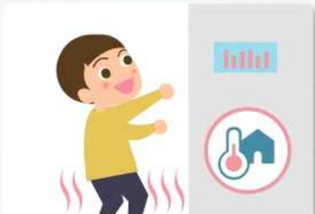
노약자, 영유아 등을 위해 적절한 실내온도를 유지합니다.