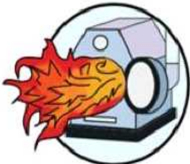
투입구 개폐 시 화상 주의