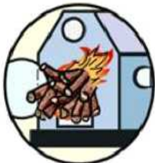
연료 한꺼번에 넣지 않기