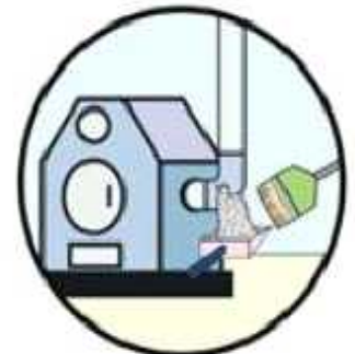
3개월에 한번 연통 청소