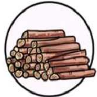
지정된 연료만 사용