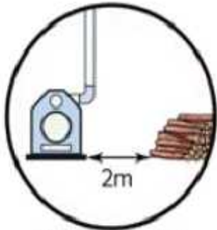
보일러와 2m 이상 떨어진 장소에 가연물 보관