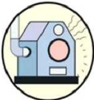
나무 연료 투입 후 투입구 꼭 닫기