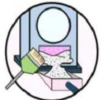
젖은 나무 사용 시 투입구 안 3~4일에 1번 청소