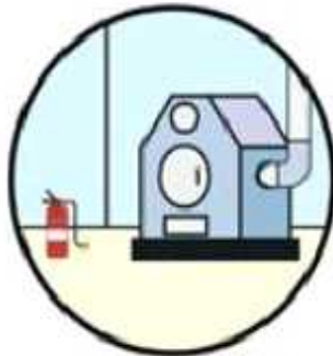
인근에 소화기 비치