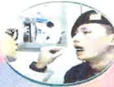
현역장병 유전자 시료채취