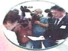
전사자 신원확인 홍보