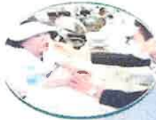
유가족 유전자 시료채취

친·외가 8촌 이내의 친인척 중 6.25 전사자 유해를 찾지 못하신 분이 계시다면 유전자 시료 채취에 참여할 수 있습니다.