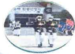
6.25 전사자 합동 안장식