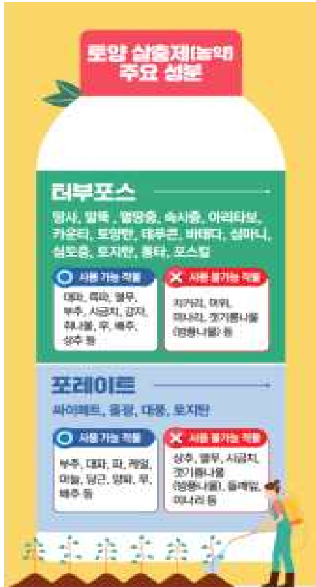
【붙임 7】 홍보 리플렛