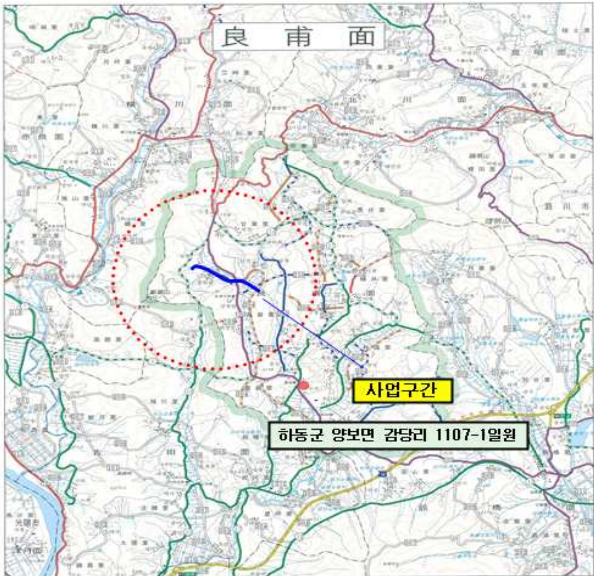
道 路 現 況