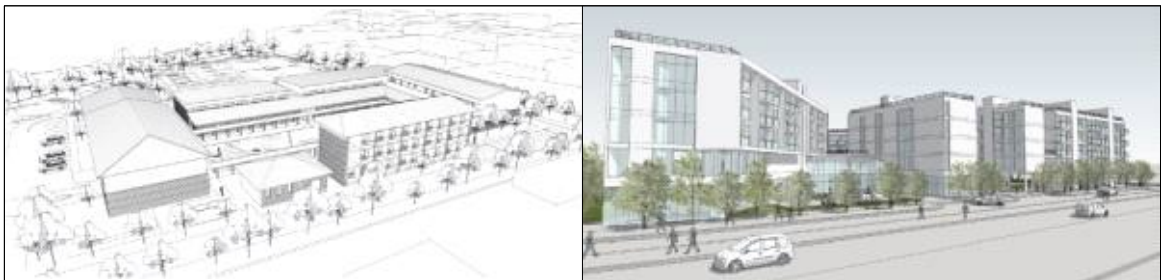
■ 그림1 <렌더링하지 않은 3차원 이미지 예시 >