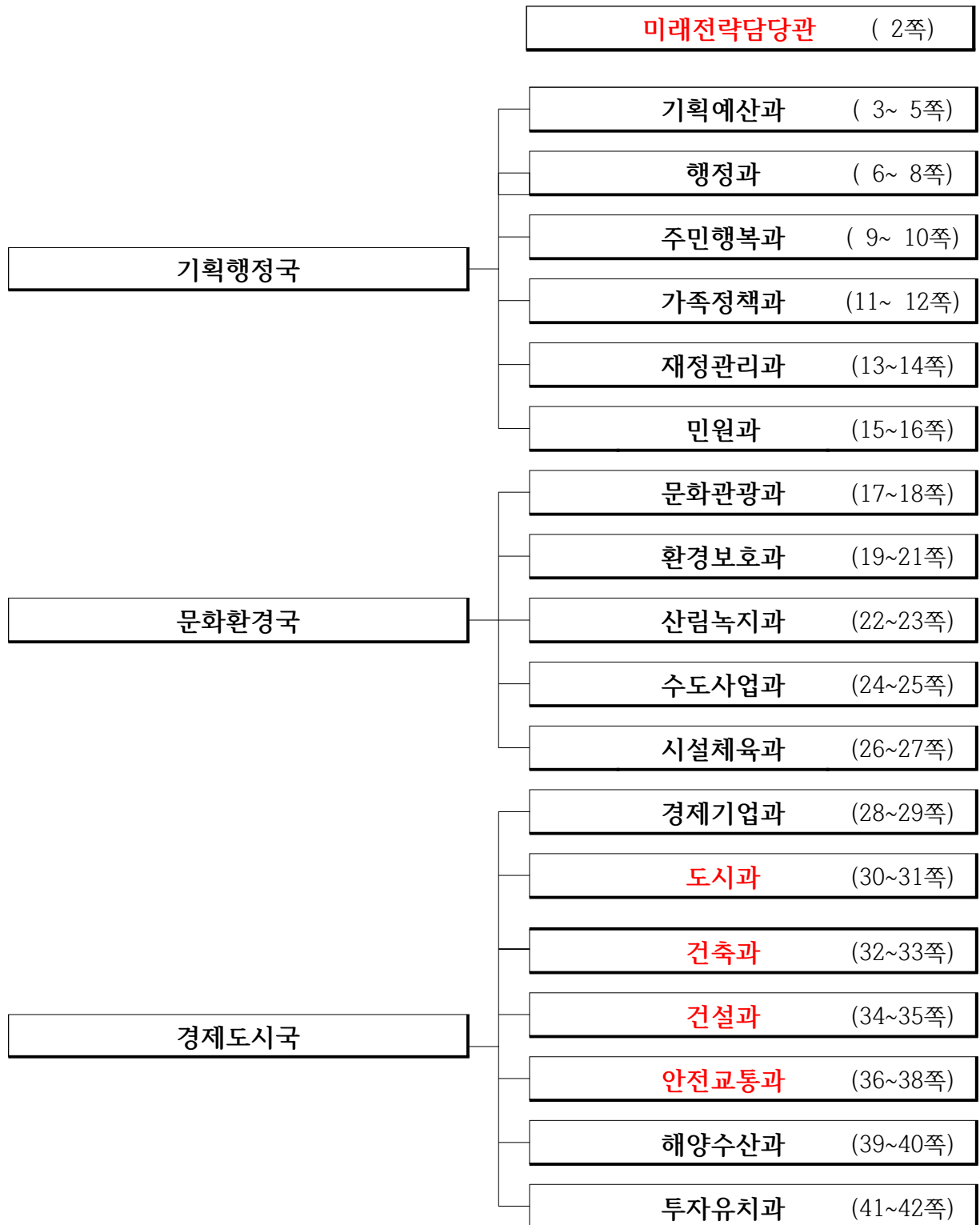
[별표 1] 군 본청 과장의 사무분장(제4조 관련)