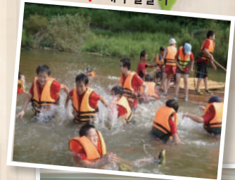
Field trip 계곡 물놀이