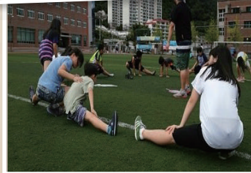
Field trip 미니 올림픽