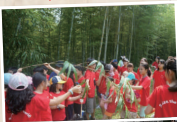
Field trip 대나무 숲길 체험