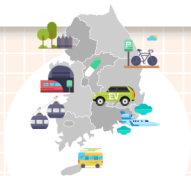
지역별 특화발전 지원