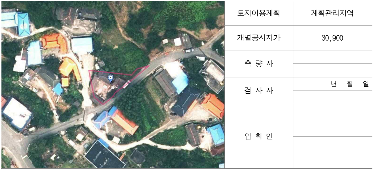
경계점 위치 설명도