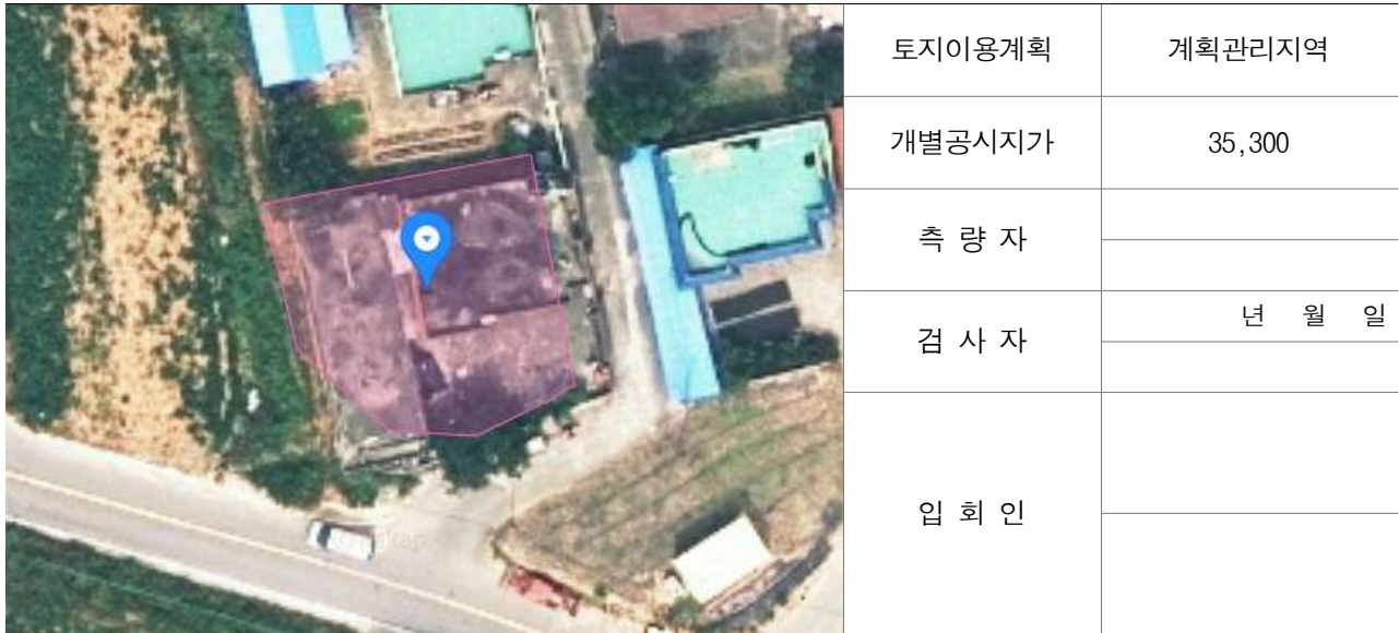
경계점 위치 설명도