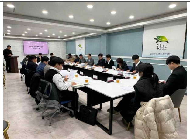
농수산대학교 총장님, 전 농촌진흥청 청장님, 경남기술원 원장님 간담회