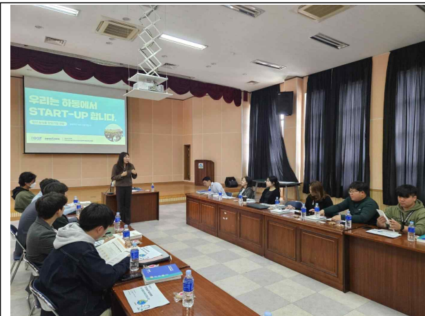
부산 농업기술진흥원 간담회