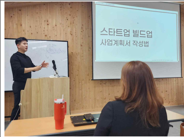
지원사업 및 사업계획서 교육