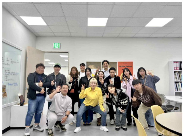
주식회사 발 견학